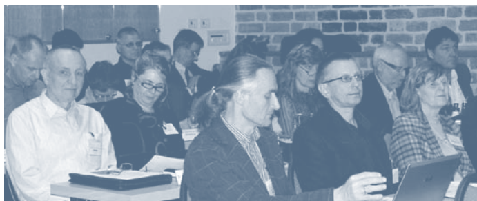
Delegierte der 11. Kammerversammlung in Stralsund

Einen ausführlichen Bericht zu diesem Thema finden Sie im PTJ 01.2012 auf den Länderseiten der OPK.